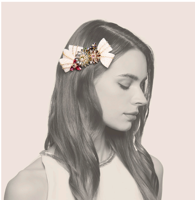
さらなる上質をめざした「Complex Biz LUXE」

1974年の創立以来、"美しさと楽しさをプロデュースする"というコンセプトのもと、全ての人の輝きを引き出すために複合的(COMPLEX)な事業を展開してまいりました。こだわりのデザインと上質な素材、品質を最大まで高める職人の手仕事、ビューティエンターテインメントを提供するスタッフにより、ヘアアクセサリ業界のパイオニアとしての地位を確立しています。