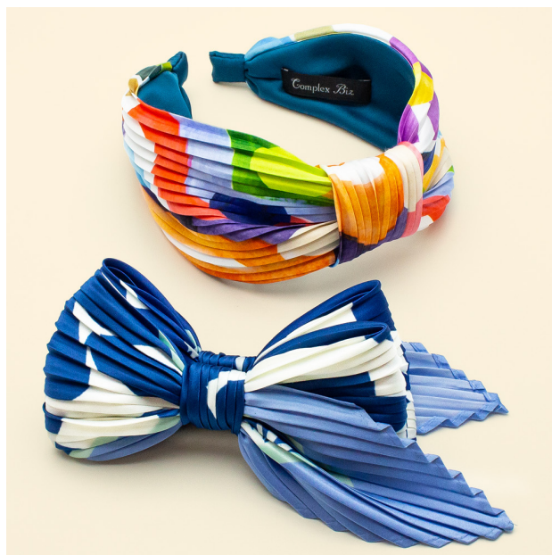
スカーフのアップサイクル(SDGsへの取り組み)