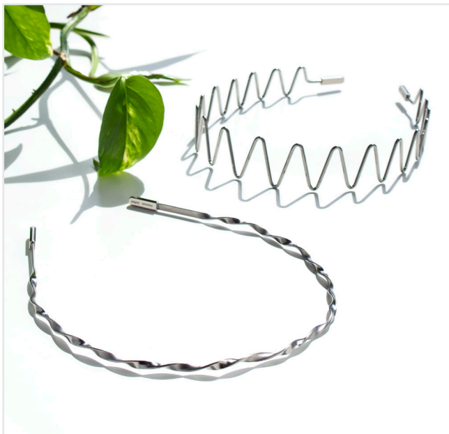
チタン製ヘアアクセサリライン「ITILU」