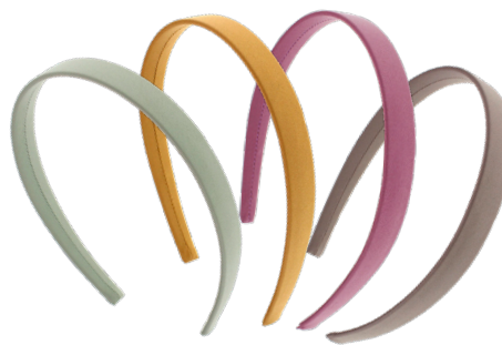
フレキシフィットヘアバンド(2020年)